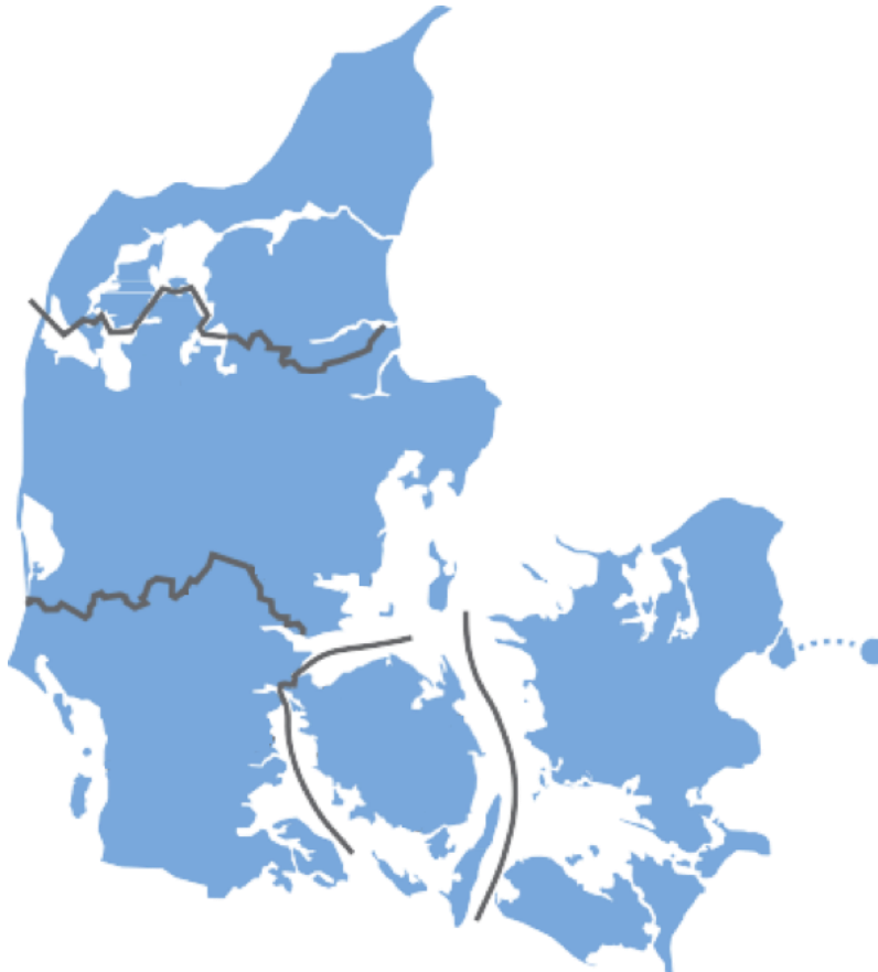
Figur 3: De lokale takstområder i Danmark og Malmø.

På figur 3 er de lokale takstområder vist på et kort over Danmark. Se også https://www.rejsekort.dk/Hjaelp/Priser